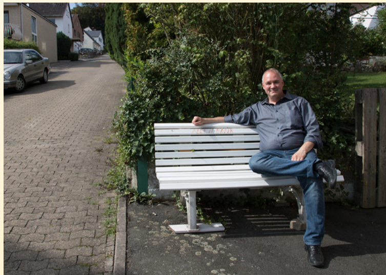
Der Projektleiter der Energieagentur testet die „Allenbank“.

Ein erstes Ergebnis der Quartiersversammlung gibt es seit Sommer die „Allenbank“ in der Bergstraße 14. Im nächsten Infobrief gibt es ein Interview mit den Initiatoren.