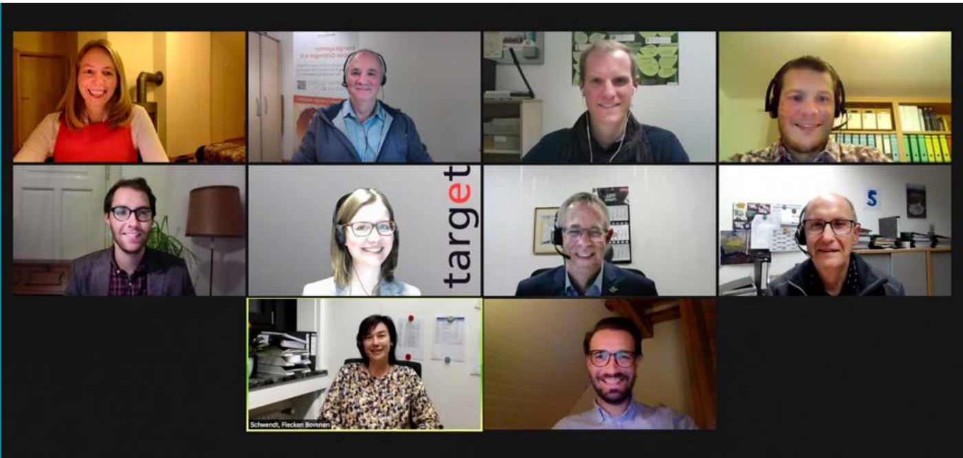
Das Team der Verwaltung des Flecken Bovendens, der Energieagentur Region Göttingen und des Ingenieurbüros target stellen sich vor.